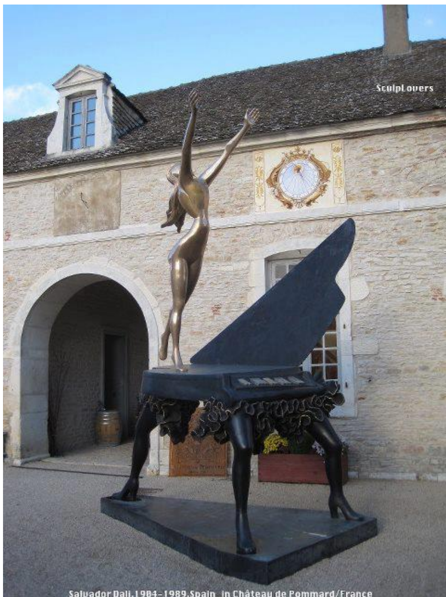
Salvador Dalí. 1984-1989. Spain. in Château de Pommard/France